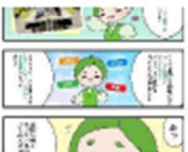
イラスト ペンタブレットを用いて、動画配信サイトで配信するためのデジタルイラスト制作をメインに行っています。その他にもオリジナルグッズのデザイン・SNS用イラスト制作等のお仕事があります。

おんらいす Office ワード、エクセル、パワーポイントを使用しての作業がメインです。 データの作成・整理 / 校正・校閲などをお願いしています。