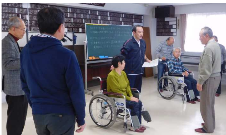
ミニ講座：片麻痺の方の移動介助の様子