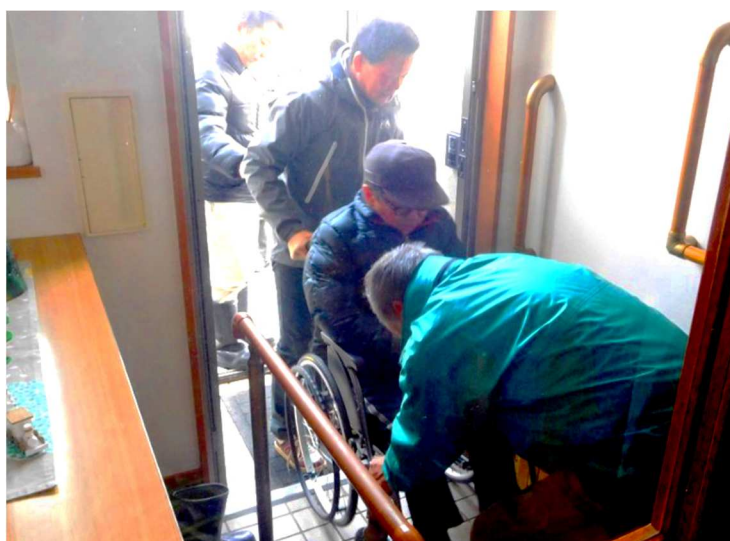
避難訓練：車椅子に乗車したまま段差を降りる介助の様子