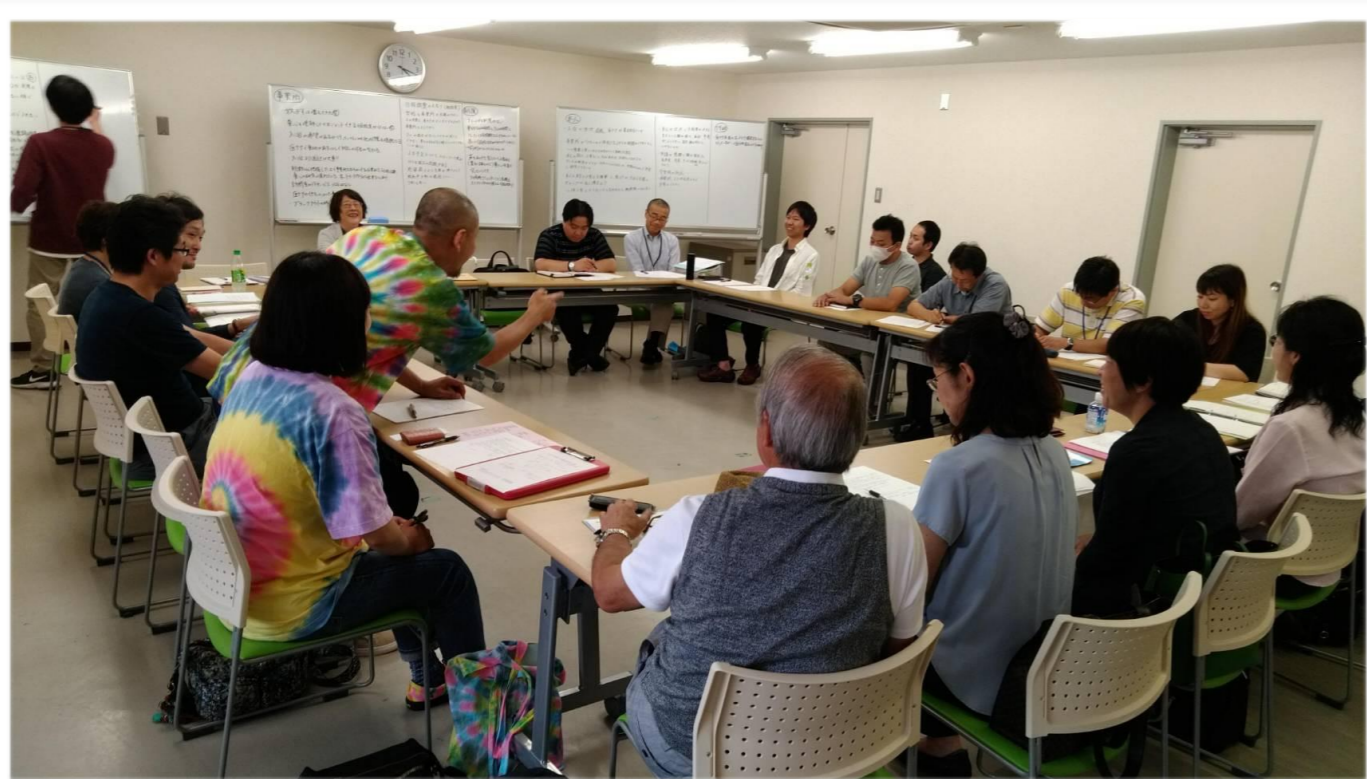
定例会当日の様子