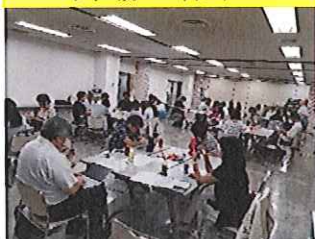
かいじょう ようす 会場の様子

さんかしや めい ちいき かだい ほか かくじぎょうしょ こんなんじれい かつぱつ じょうほうこうかん おこな 参加者45名で地域の課題の他、各事業所での困難事例など活発な情報交換が行われま した。今後も定期的に茶話会を行っていきます。