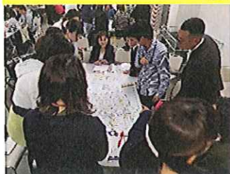
かいじょう ようす 会場の様子

とうじつ しょ じぎょうしょ さいがいじ ぼうさい さんこうしりょう こうかい たいへん も また、当日は2か所の事業所の災害時防災マニュアルも参考資料として公開され、大変盛 あ り上がりました。