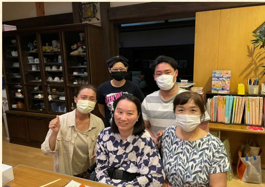
にゅうよくかいじょご 入浴介助後に りようしゃさま 利用者様と

せいこうケアサービスでは、いまげんざい さい さい はばひろ ねんれいそう りようしゃさま 今現在21歳から92歳までの幅広い年齢層の利用者様がおり、ひとりひとりの生活に沿った無理のない自立をサポートさせていただいております。