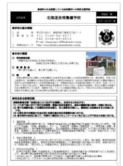
道立特別支援学校高等部のしおり より一部抜粋

北海道教育委員会では、今年度も全14管内にて特別支援教育指導協議会を実施し、中学校第3学年の子どもをもつ保護者や担任教諭に情報発信をしています。その内容を令和2年9月10日～12月25日まで期間限定で配信しています。また、ホームページにて昨年の紙面による学習状況検査について全ての問題を掲載し、教材等による学習状況検査については、一部抜粋したものを掲載しています。